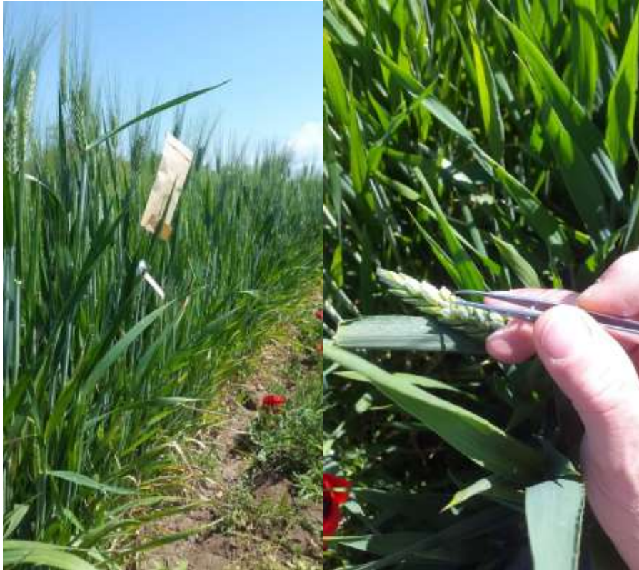
Figura 4. Incroci fra linee superiori per una coltivazione in regime organico.