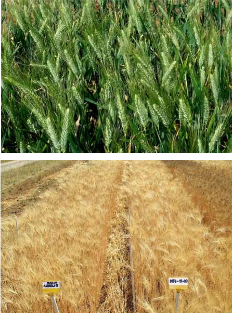
Fig. 5. Allevamento in campo (Azienda agraria dell'Università della Tuscia, Viterbo) di un triplo ricombinante di frumento duro a resa elevata, ottenuto tramite l'ingegneria cromosomica, in fase di maturazione precoce (in alto) e completa (in basso a destra).