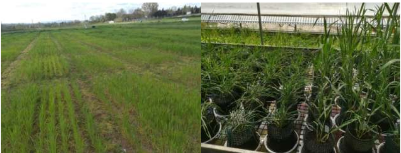
Figura 1. Parcelle sperimentali a Viterbo nella stagione 2018-2019 (a Sinistra), e prova in net-plots per la valutazione dell'apparato radicale (a destra).

EU project ECOBREED (grant number 771367) e MIUR – “Dipartimenti di Eccellenza” (Legge 232/2016) per il supporto finanziario.