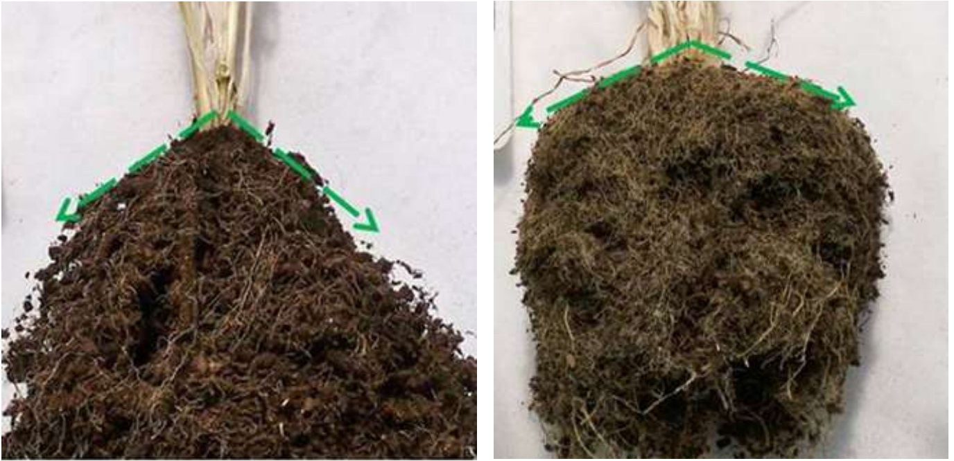
Figura 2. Accessioni con contrastante angolo radicale.