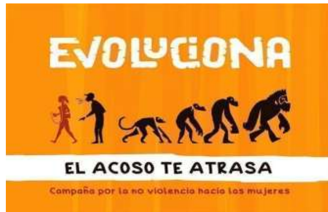
Fig. 1- Imagen de la campaña cubana Evolucionona.

torno a la violencia de género. Bajo el eslogan “el acoso te atrasa” la iniciativa llama a todos a luchar en contra de la violencia de la que son víctimas las mujeres.